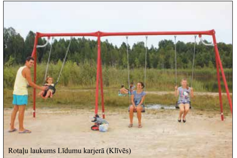
Rotaļu laukums Līdumu karjerā (Klīvēs)